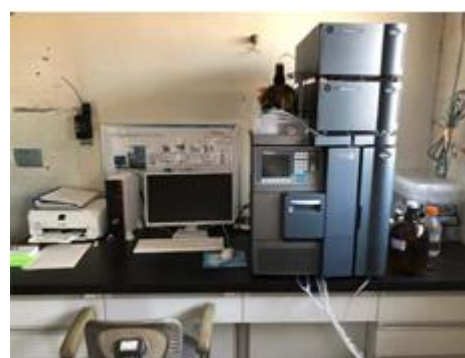
高速液体クロマトグラフ