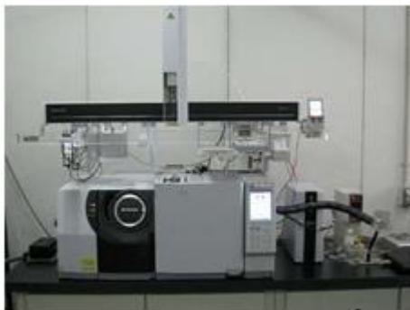
ガスクロマトグラフタンデム質量分析装置

ドラム(試験用、小型、中型)、工業用ミシン、万能型引張試験機、すき割り機、小型走査型電子顕微鏡、屈曲試験機、バイブレーションステッキングマシン、示量走査熱量計、ウエザオメータ、バタ振り機、原子吸光分光分析装置、皮革熱収縮温度測定機、ロールコーター、可視紫外分光光度計、染色堅ろう度試験機、ロールアイロン、高速液体クロマトグラフ、テーパ形摩擦試験機、皮革用レーザー加工機、電子捕獲検出器付ガスクロマトグラフ分析装置、ガスクロマトグラフタンデム質量分析装置、フーリエ変換赤外分光光度計、示差熱分析装置