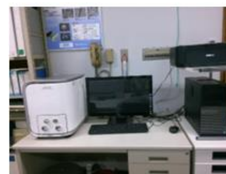
小型走査電子顕微鏡